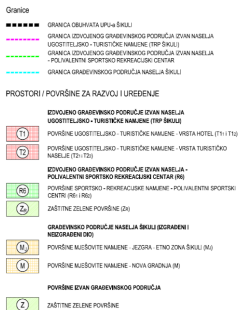
Izvadak iz kartografskog prikaza br.1. Korištenje i namjena površina